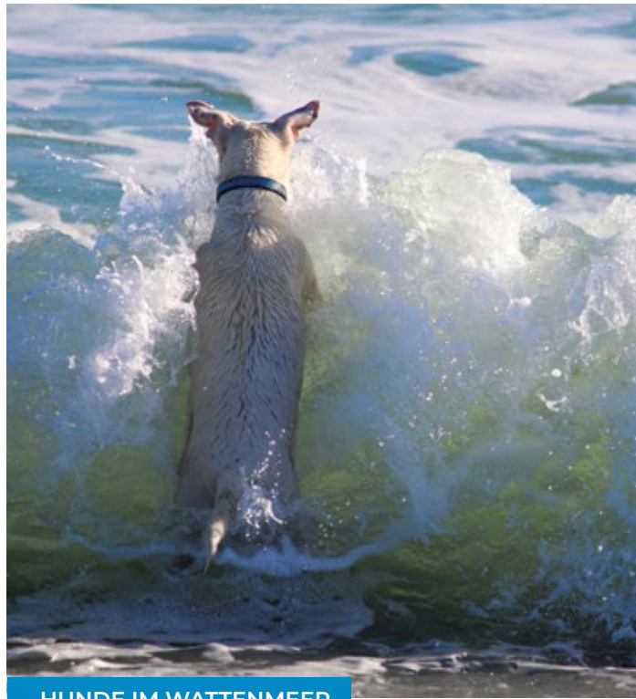
HUNDE IM WATTENMEER

Auf den gesamten Deichkronen, auf dem rot geklinkerten Deichkronenweg im Strandbereich, dürfen Hunde an der Leine spazieren gehen. Von Oktober bis März können Hunde zudem am Wasser auf der Deichpromenade angeleint den Urlaub genießen.